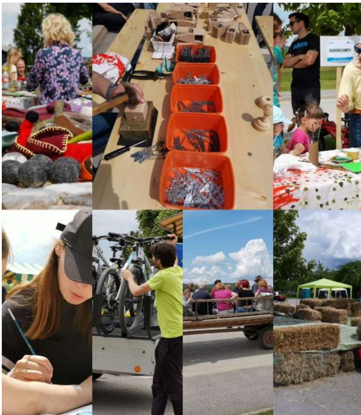
Slika 17: Utrinki raznoraznih aktivnosti in delavnic, ki so potekale tekom celotnega dneva