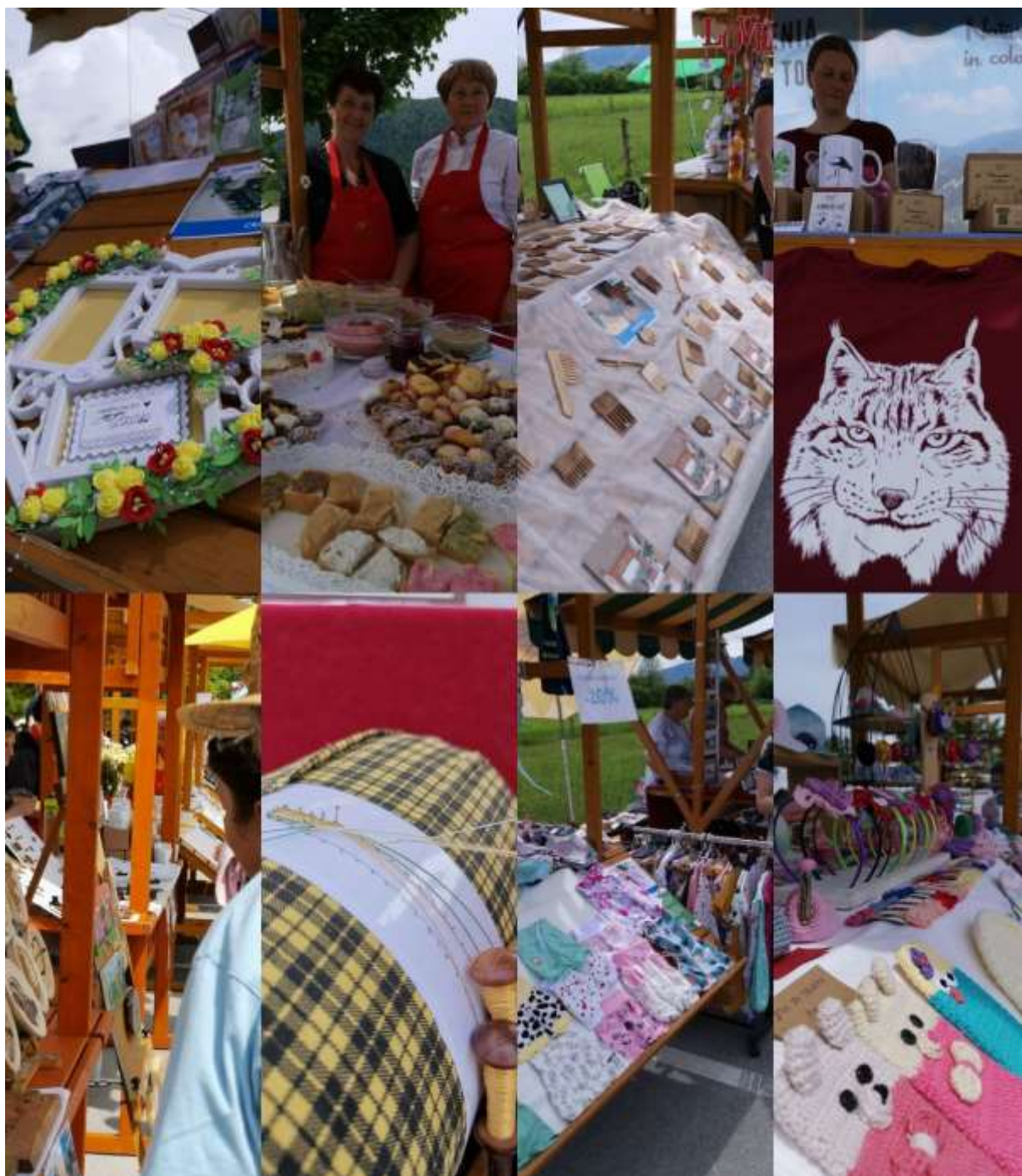
Slika 13: Utrinki iz obrtniških stojnic