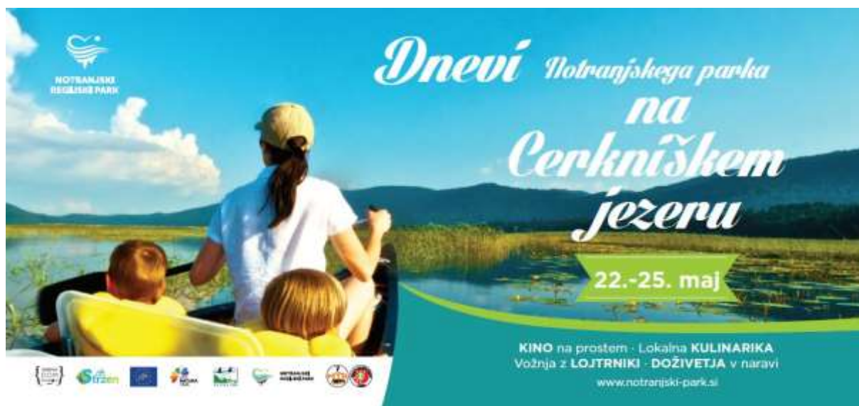
Slika 10: Letak za promocijo Dni Notranjskega parka

Še nekaj utrinkov s sobotnega dogajanja: