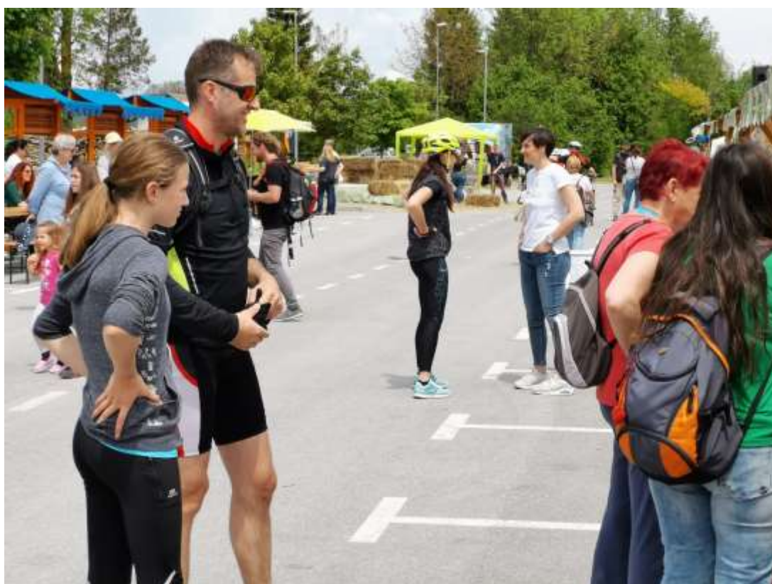
Slika 15: Pri stojnicah se ni manjkalo obiskovalcev