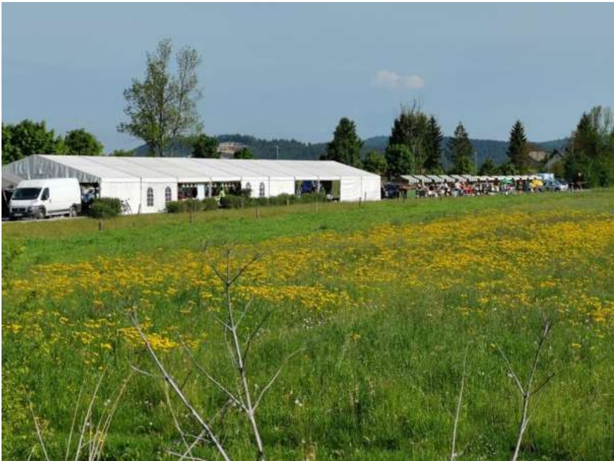
Slika 9: Pogled na prizorišče iz poti med koticom projekta LIFE for LASCA in LIFE Stržen

Na osrednjem prizorišču je hrano prodajalo 7 različnih ponudnikov, med njimi tudi Lovska družina Cerknica in Ribiška družina Cerknica, ki sta ključna deležnika projekta LIFE Stržen. Sodelovalo je tudi 19 prodajalcev oziroma društev, ki so prodajali svoje izdelke ali samo predstavljali svojo dejavnost. Večino ponudnikov je bilo iz lokalnega okolja, saj so imeli pri razpisu domačini prednost. Prav tako so na glavnem prireditvenem prostoru potekale raznorazne delavnice za otroke – od izdelovanja poljšjih »škrinc« do barvanja na tekstilne vrečke z naravnimi barvili.