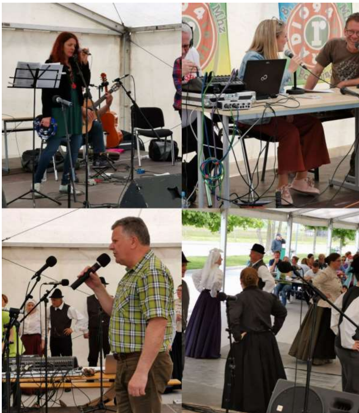
Slika 16: Utrinki kulturnega dela programa