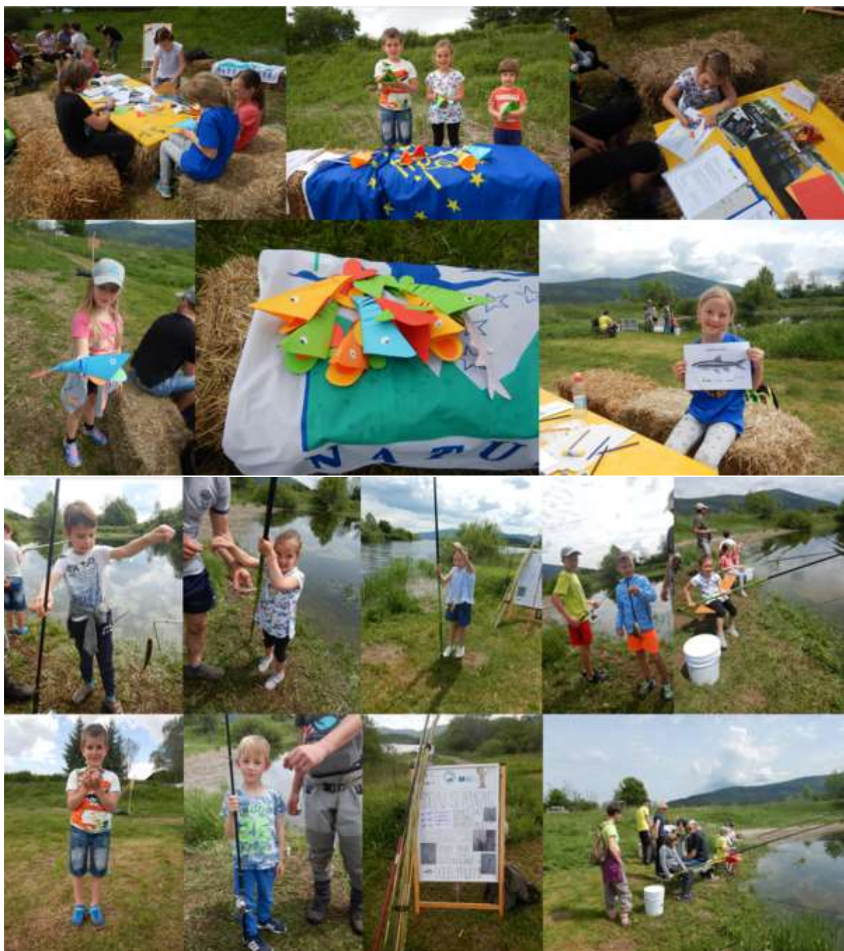
Slika 3: Kolaž utrinkov iz kotička projekta LIFE for LASCA