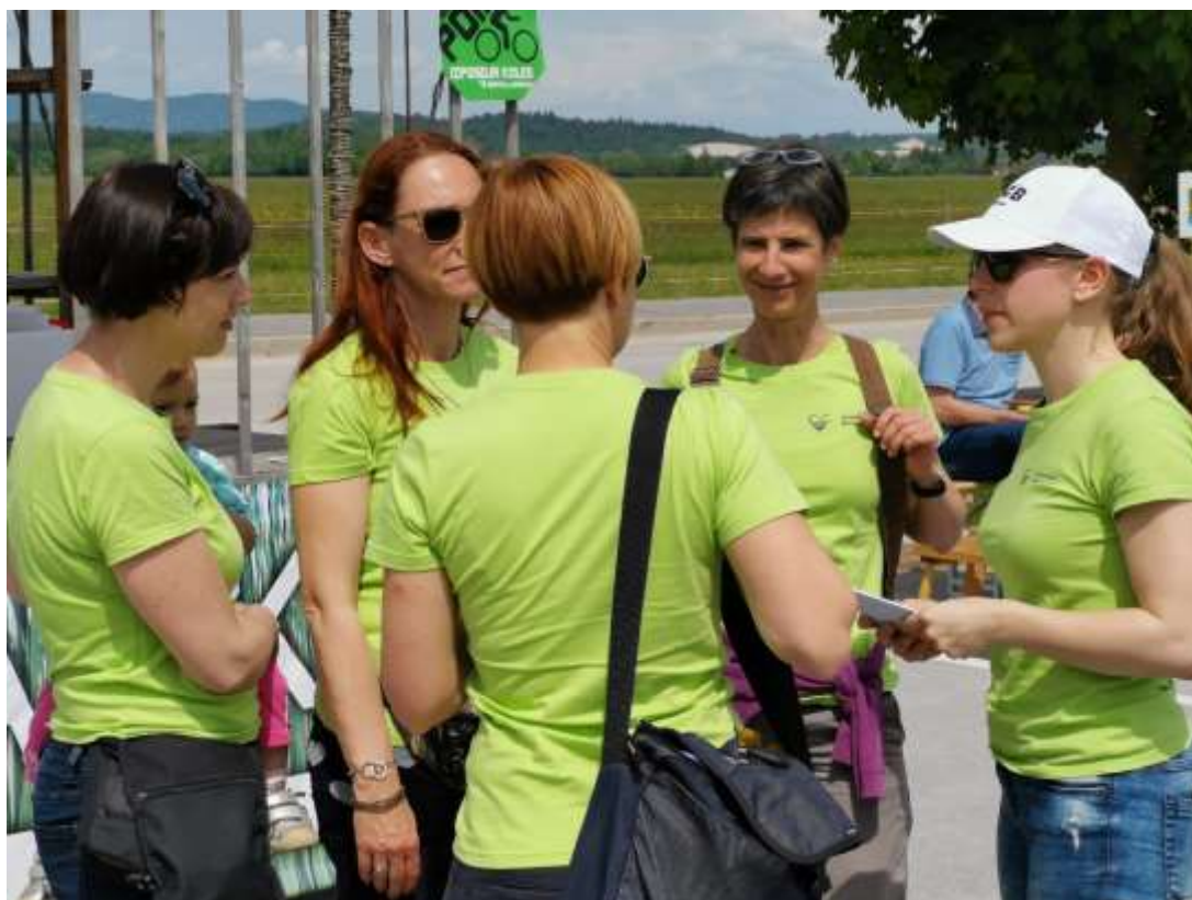
Slika 14: Ekipno posvetovanje organizatorok