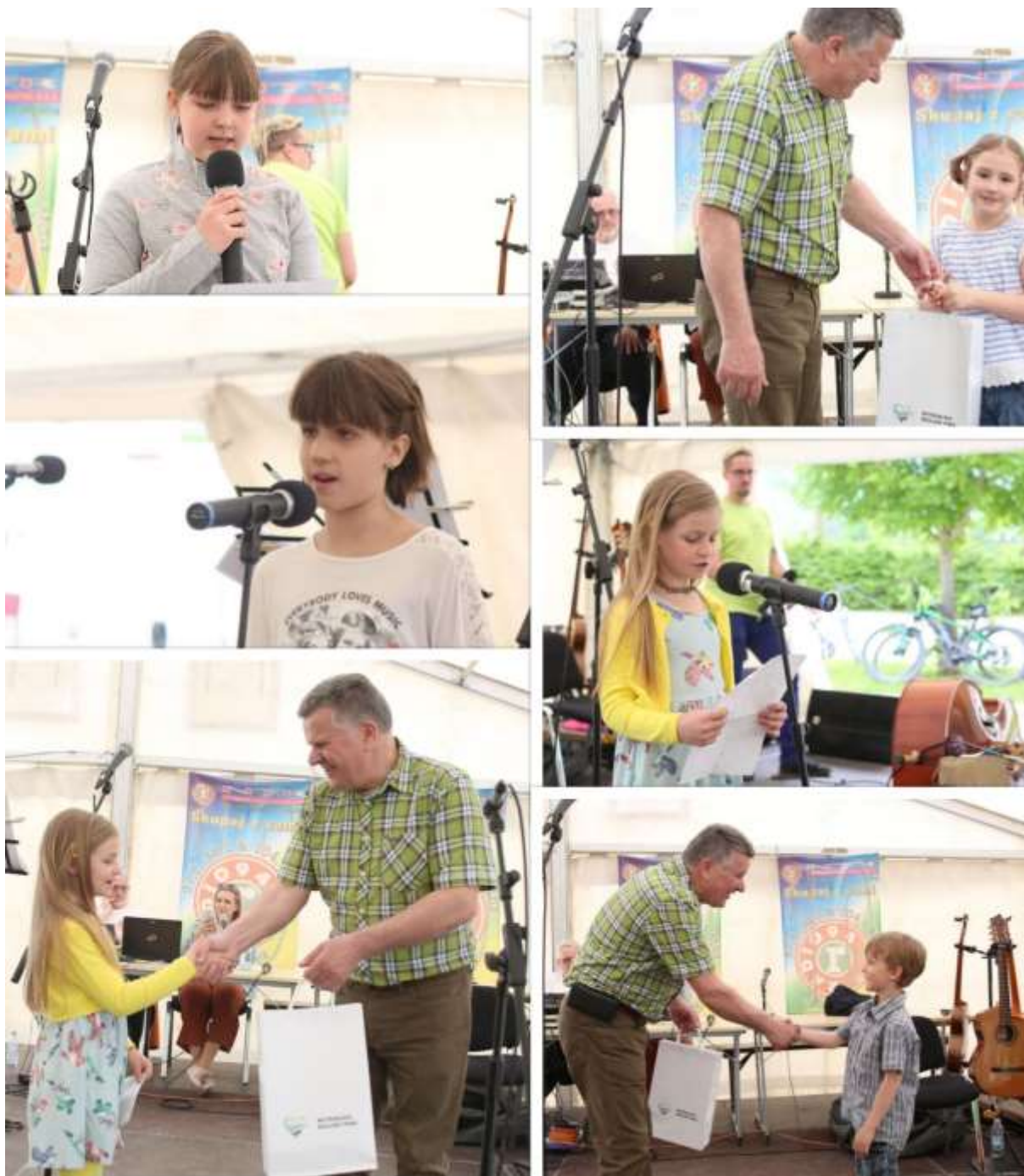
Slika 19: Med kulturnim programom smo povabili nagrajence ustvarjalnega natečaja projekta LIFE Stržen, da predstavijo svoje izdelke na odru, nato pa jim je nagrade podelil župan Občine Cerknica.