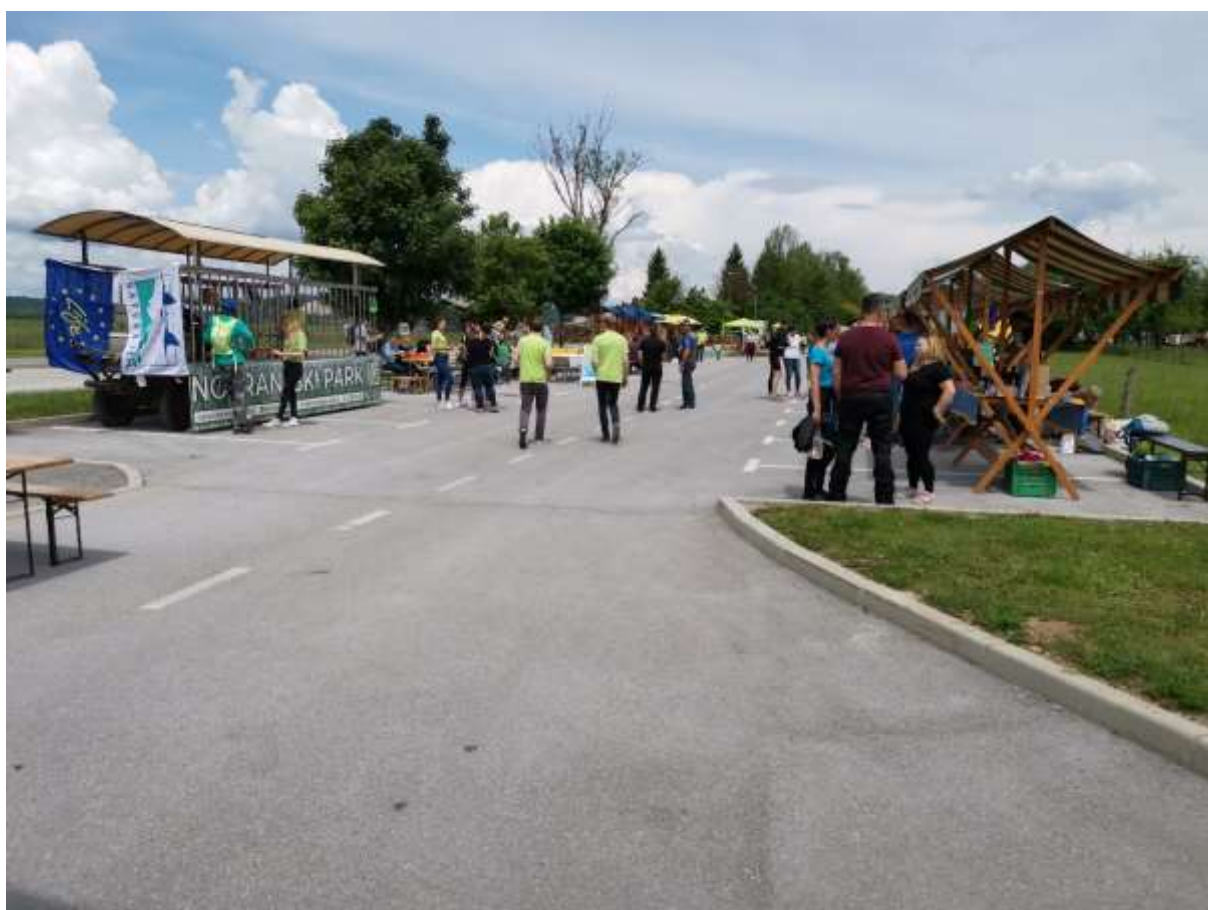
Slika 11: Pogled na obrtniške stojnice in informacijski lojtrnik, okrašen z LIFE in Natura 2000 zastavami

Še nekaj utrinkov s sobotnega dogajanja: