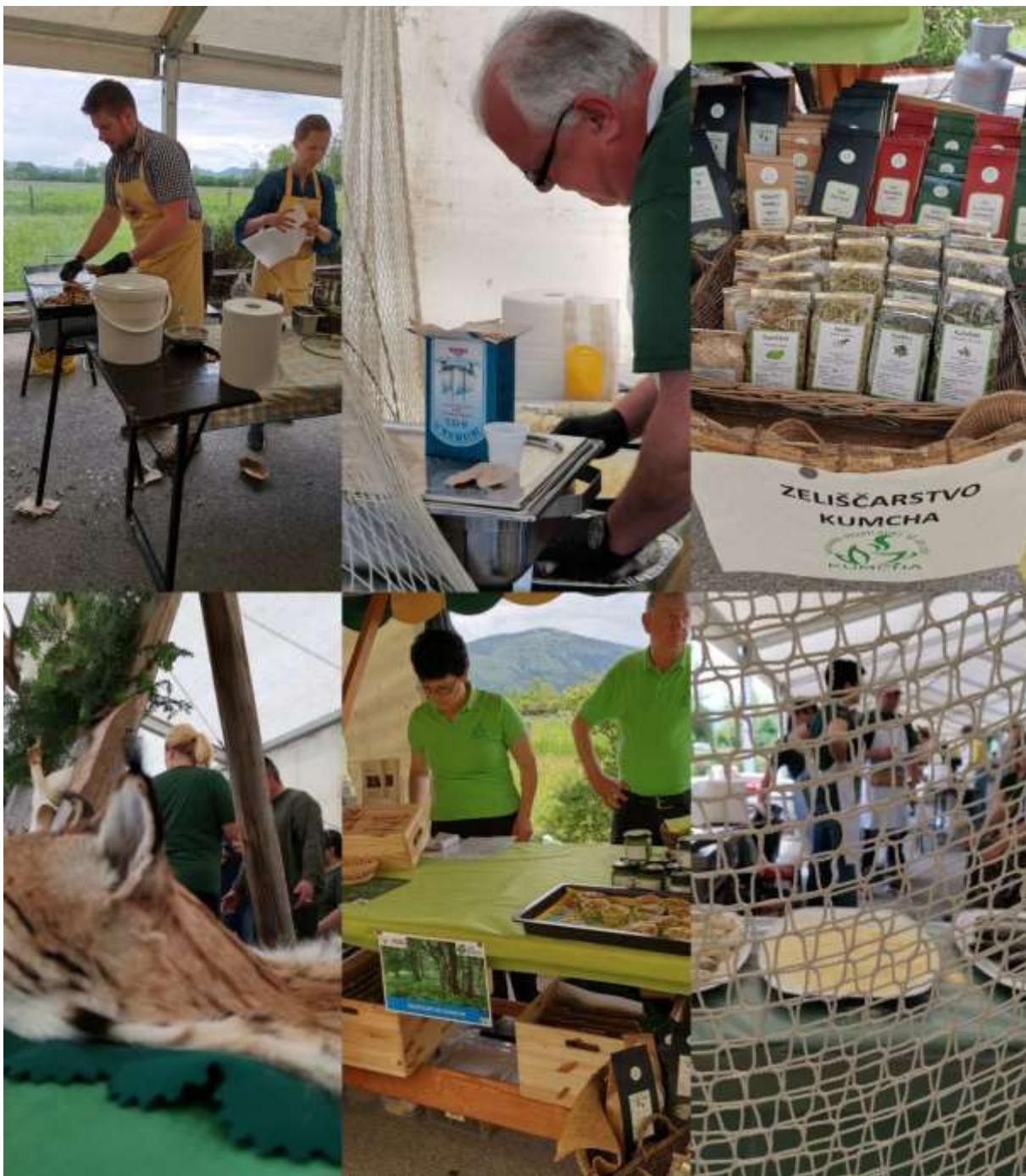
Slika 12: Utrinki iz kulinarčnih stojnic