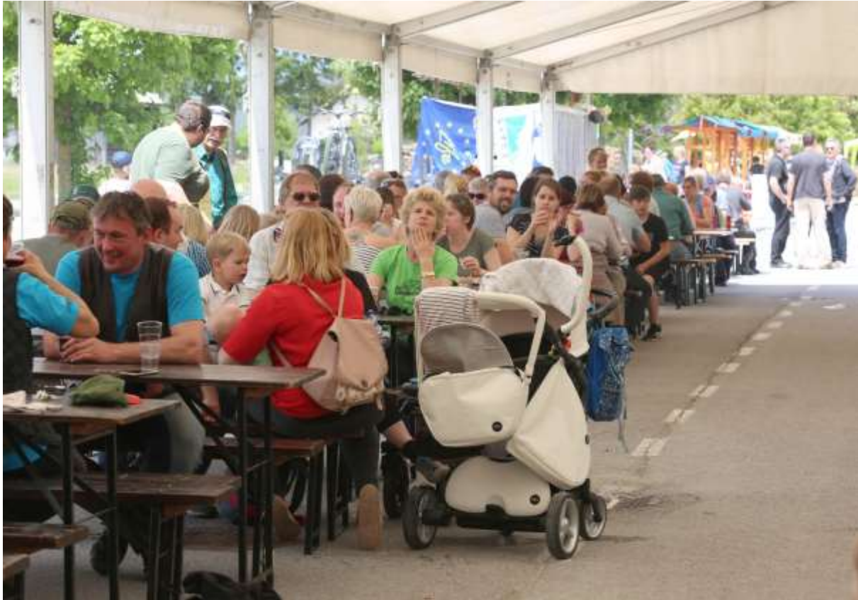
Slika 1: Mize pod šotorom so bile ves čas prireditve polno zasedene.

Osrednja prireditvev – Dan Notranjskega parka – je potekala v soboto, 25. maja 2019, na parkirišču ob Cerkniskem jezeru, na koncu vasi Dolenje Jezero. Aktivnosti so se začele izvajati že ob 8.00 zjutraj, stojnice in delavnice pa ob 9.00 zjutraj. Pri izvajanju aktivnosti so sodelovala mnoga lokalna društva in vodniki. Program prireditve je bil sledeč: